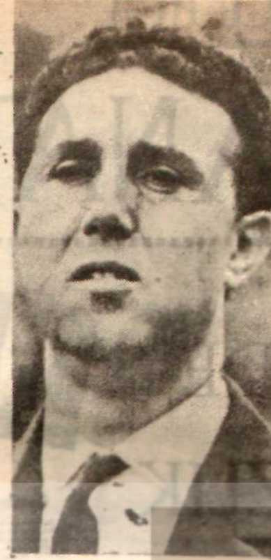
Başbakan Bin Bella - Fransız çiftlikleri Cezayirlilerin -

Cezayir Başbakanı Bin Bella, iktidara geçtiği günden beri çiftliklerini terk edip anavatanına kaçmış olan Fransızların dönmesini bekledi. Başbakanın bir Cezayirli olarak kabul edilip çalışmasını istediği Fransız asıllı çiftçilerden pek dönen olmadı. Oysa Cezayir'de insanlar aç ve işsiz ve tarlalar bomboştu. Bu