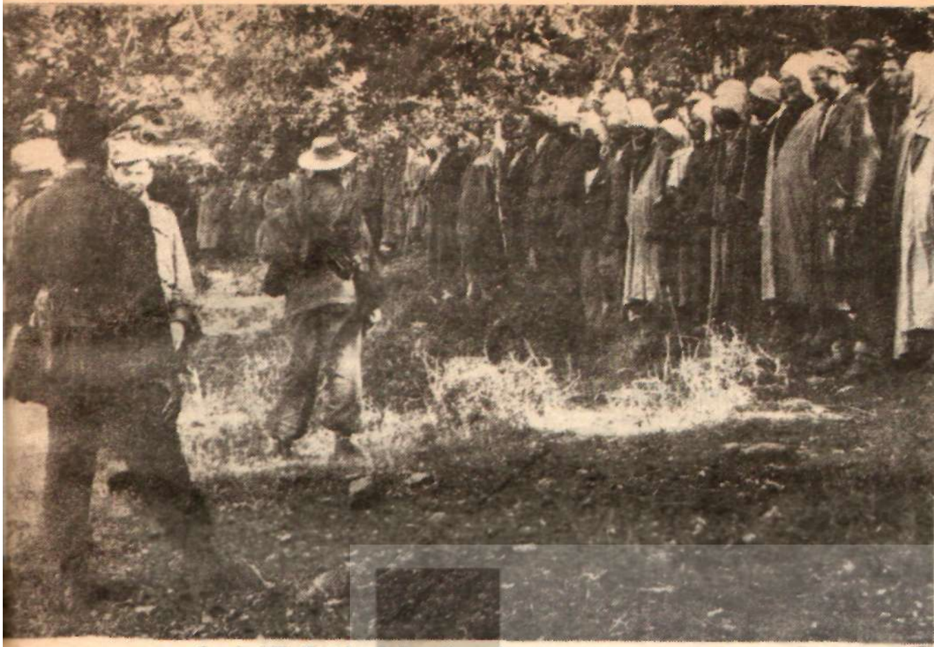
KURTULUŞ — Cezayir Milli Kurtuluş Ordusu bir yandan düşmanla savaşırken öte yandan bağımsızlık sonrası meseleleriyle uğraştı. Resimde köylülere toprak reformu, kooperatif ve sosyalizm hakkında bilgi veren ihtilâlcî ses baylar görülüyor.