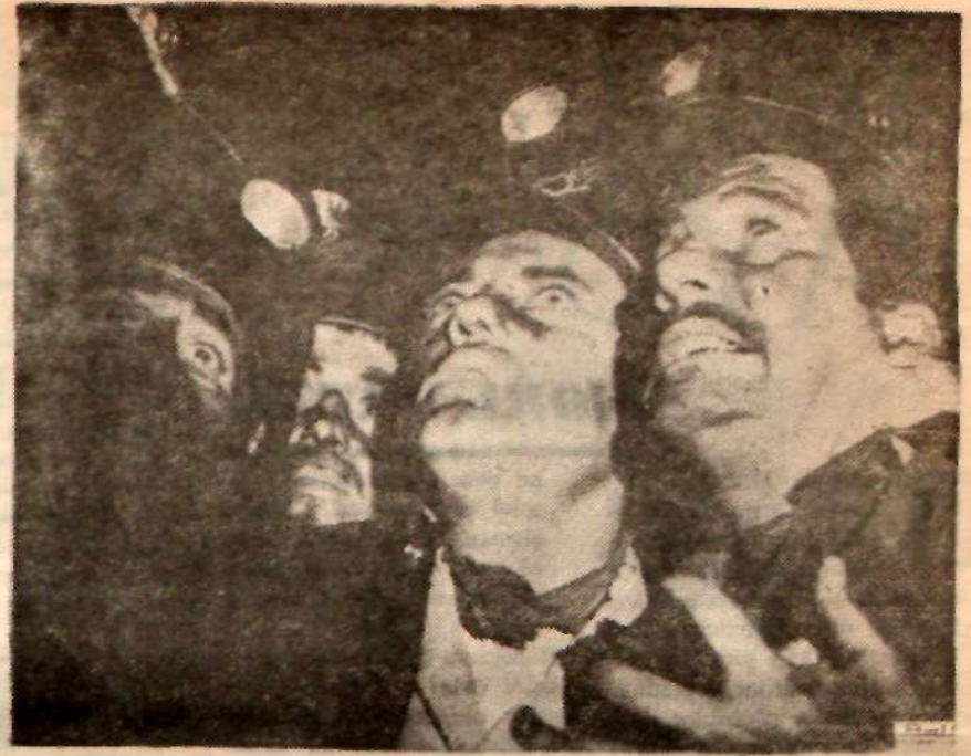
ŞEHİRDEKİ YABANCI — Kamera Zonguldak'taki kömür işçileri arasında