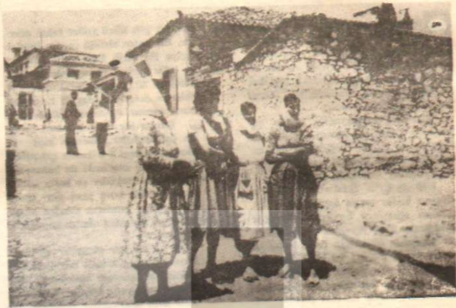
BADEMLER KÖYÜ KADINLARI Medeniyet savaşını da erkeklerle elele

gibi alış veriş edin, yakarmaya pay dos.