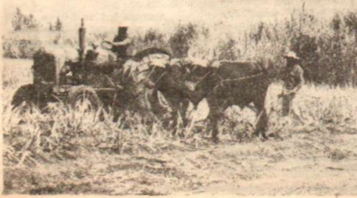
MEKSİKADA BİR KOOPERATİF: Her vasıttan yararlanarak üretimi arttırmak için eski metod ve vasıtaları yenileriyle değiştirmek...

Çağımızdaki gelişmeler emperyalistleri de bazı yeni metodlar bulmağa zorlamıştır. Az gelişmiş memleketlere açılan krediler, fabrika kurmak için yapılan yardımlar bunlar arasındadır. Ama genel olarak siyasi şartlara göre ayarlanan bu kredilerin çoğu zaman üretken olmayan amaçlara, ya da bu memleketlerin milletlerarası kapitalizme bağımlılığını daha da ağırlaştıran ekonomi kollarının gelişmesine yöneltildiği görülmektedir.