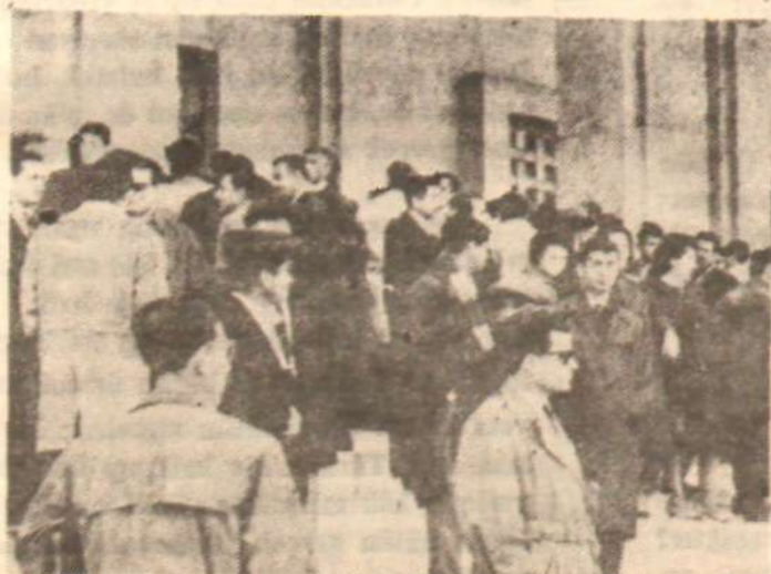
5 NİSAN GÖRÜŞMELERİNDE MECLİSE GİREMİYENLER

Doğrusu, hayır. Bu konuşmalar çok zaman bir kahve po-